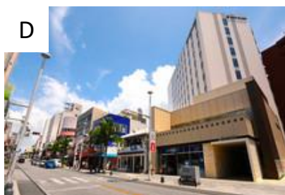
ホテルグレイスリー那覇