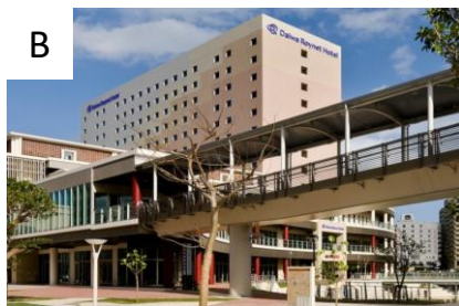
ダイワロイネットホテル那覇国際通り