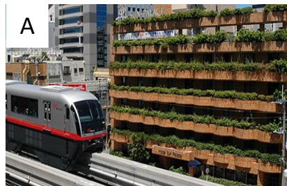
サンパレス球陽館