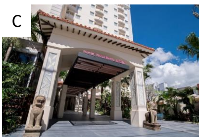
パームロイヤルNAHA国際通り