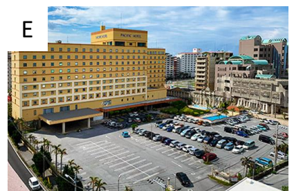
パシフィックホテル沖縄